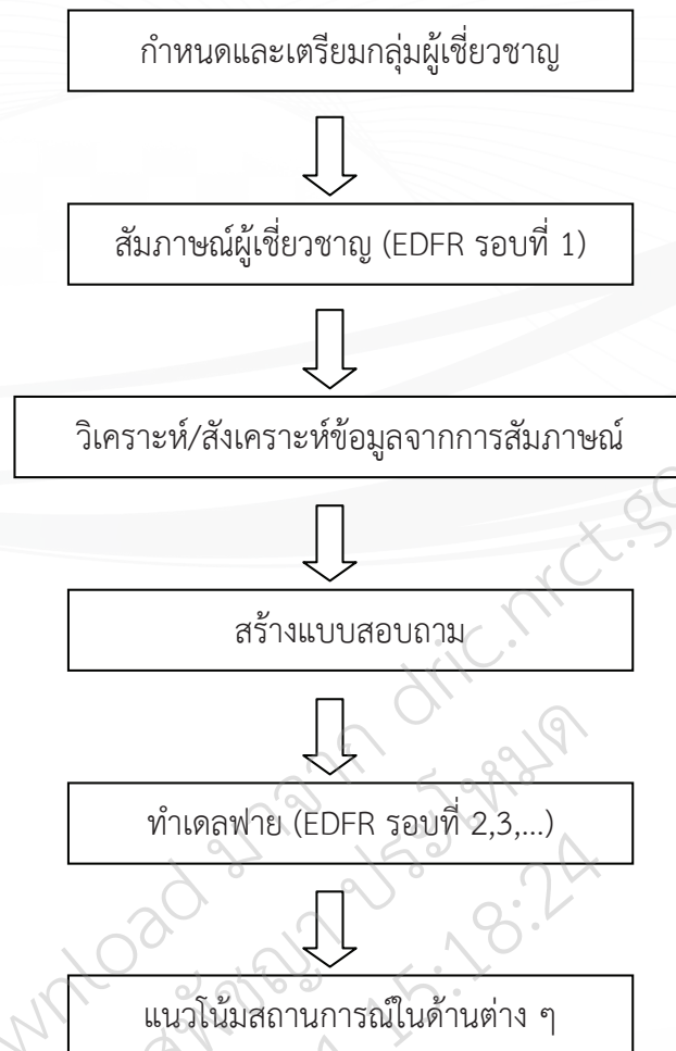
ภาพที่ 2 ขั้นตอนของการวิจัยแบบ EDFR