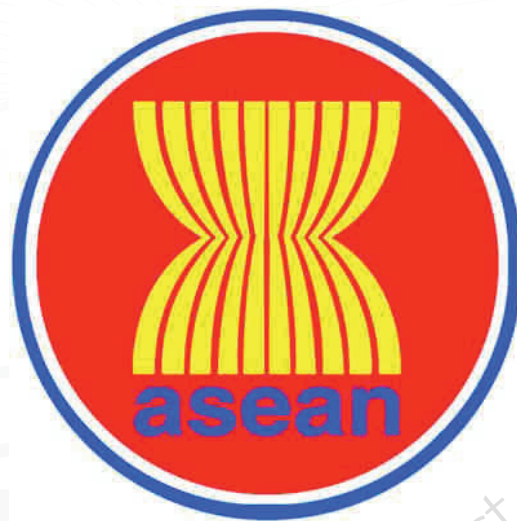
ภาพที่ 1 สัญลักษณ์ของประชาคมอาเซียน